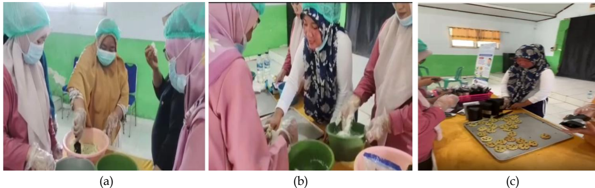
Gambar 3. Pembuatan Cookies Fortifikasi Daun Kelor dan Tulang Ikan Lele; (a) Pencampuran Bahan Cookies ; (b) Pencetakan Cookies ; (c) Hasil Pemangangan Cookies

Sebagai luaran non-metrik, dua kelompok kader membentuk usaha pangan lokal bernama “Hunggaluwa Sehat” yang berfokus pada produksi cookies bergizi. Luaran ini mencerminkan peningkatan kapasitas sosial kader dan potensi keberlanjutan program, meskipun evaluasi dampak langsung terhadap status gizi anak belum dilakukan.